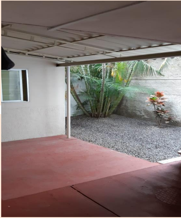
PATIO Y TERRAZA