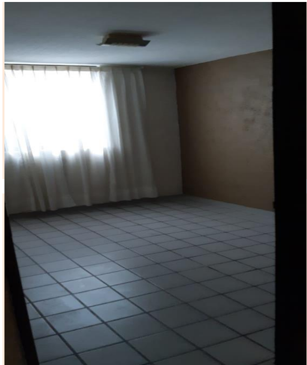
SALA Y COMEDOR